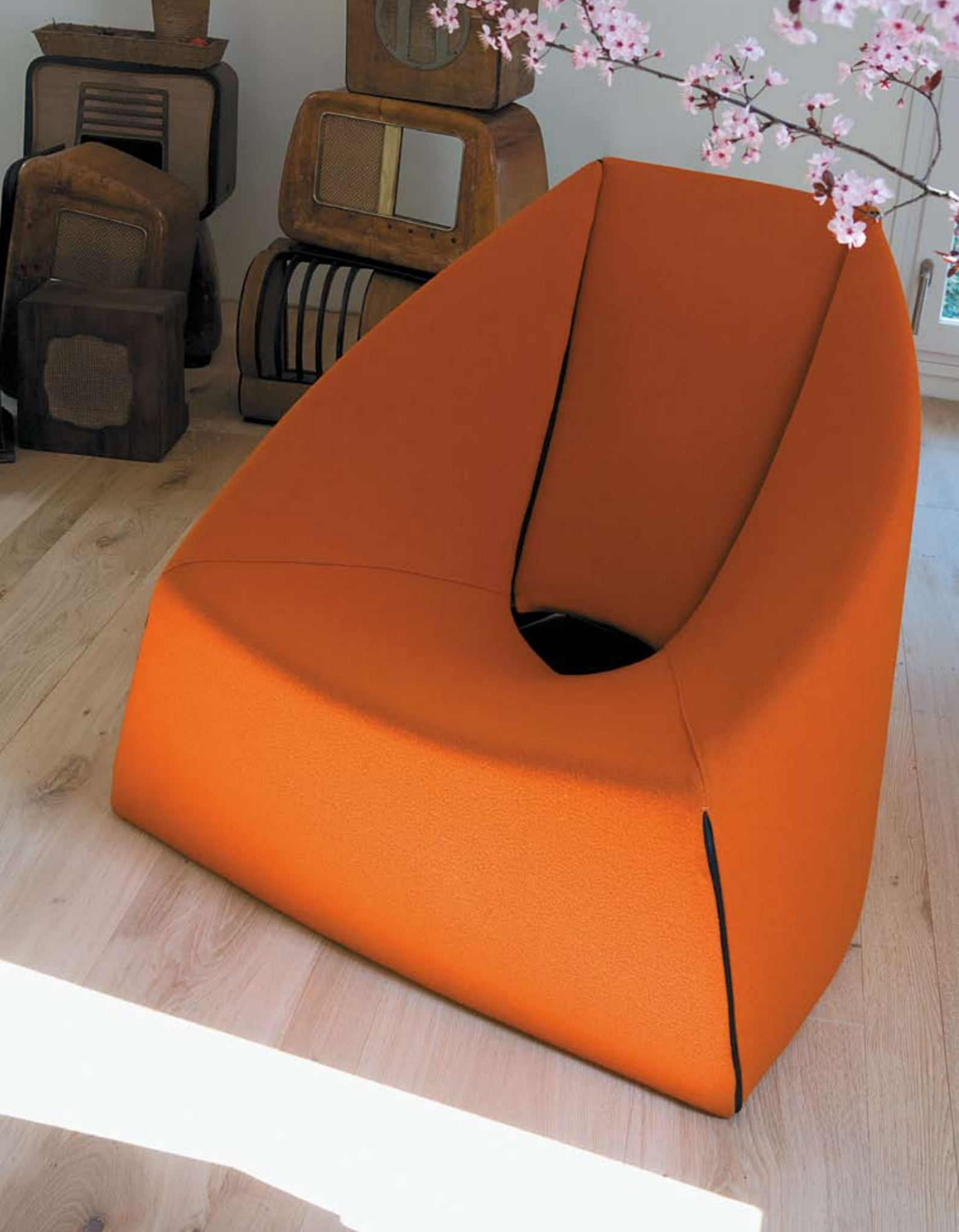
Ubu design Mario Guidarelli poltrona / armchair