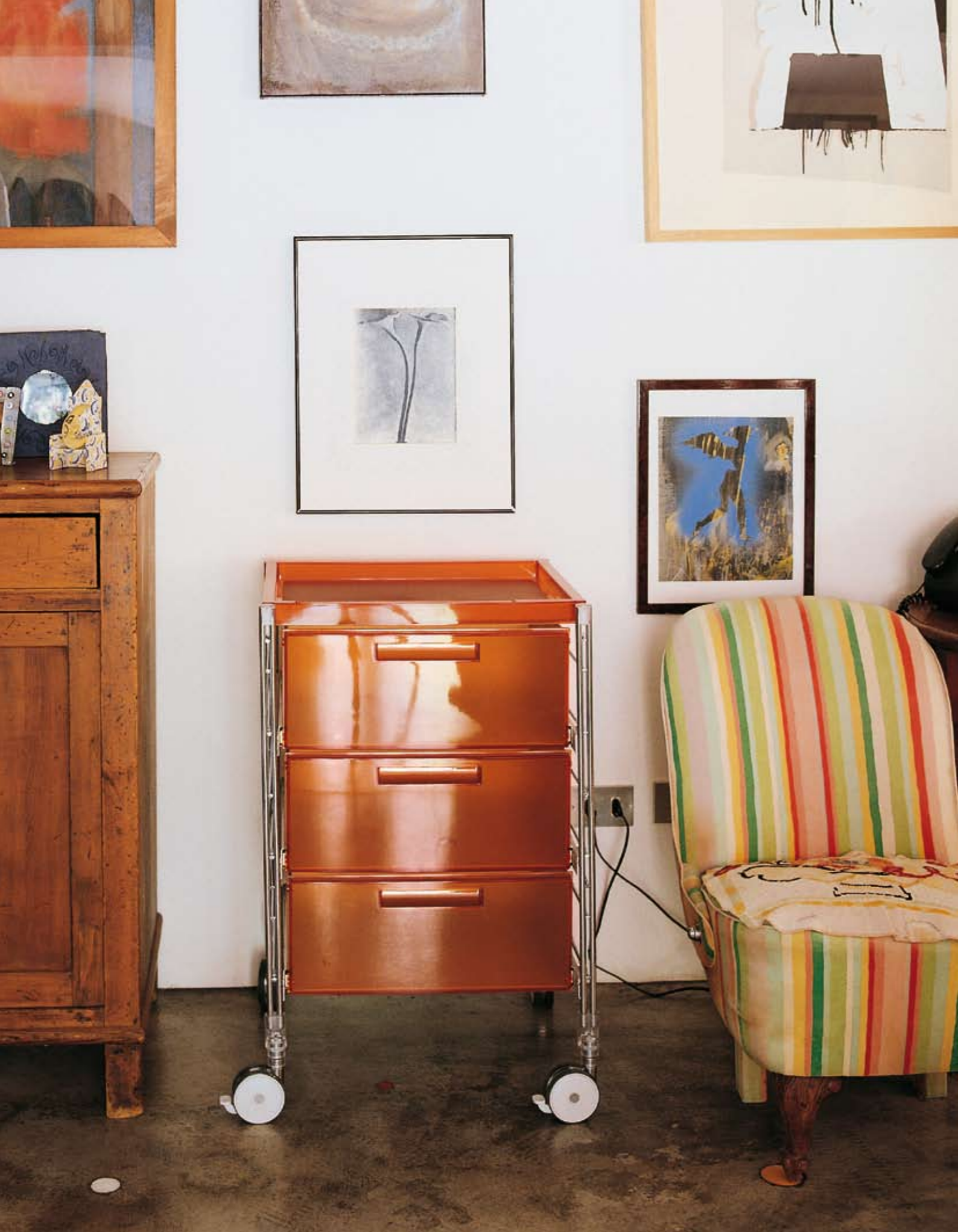
Festival Trolley design Baldanzi & Novelli cassettera modulare / modular drawer