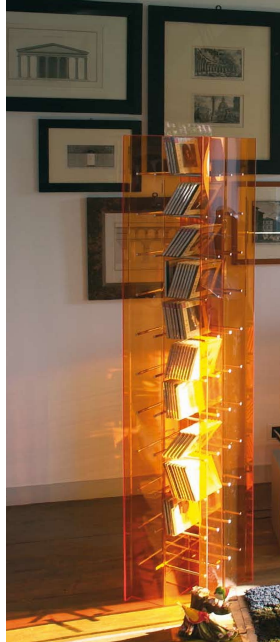
Music Totem design Giusi & Fabio Lombardo porta cd / cd rack