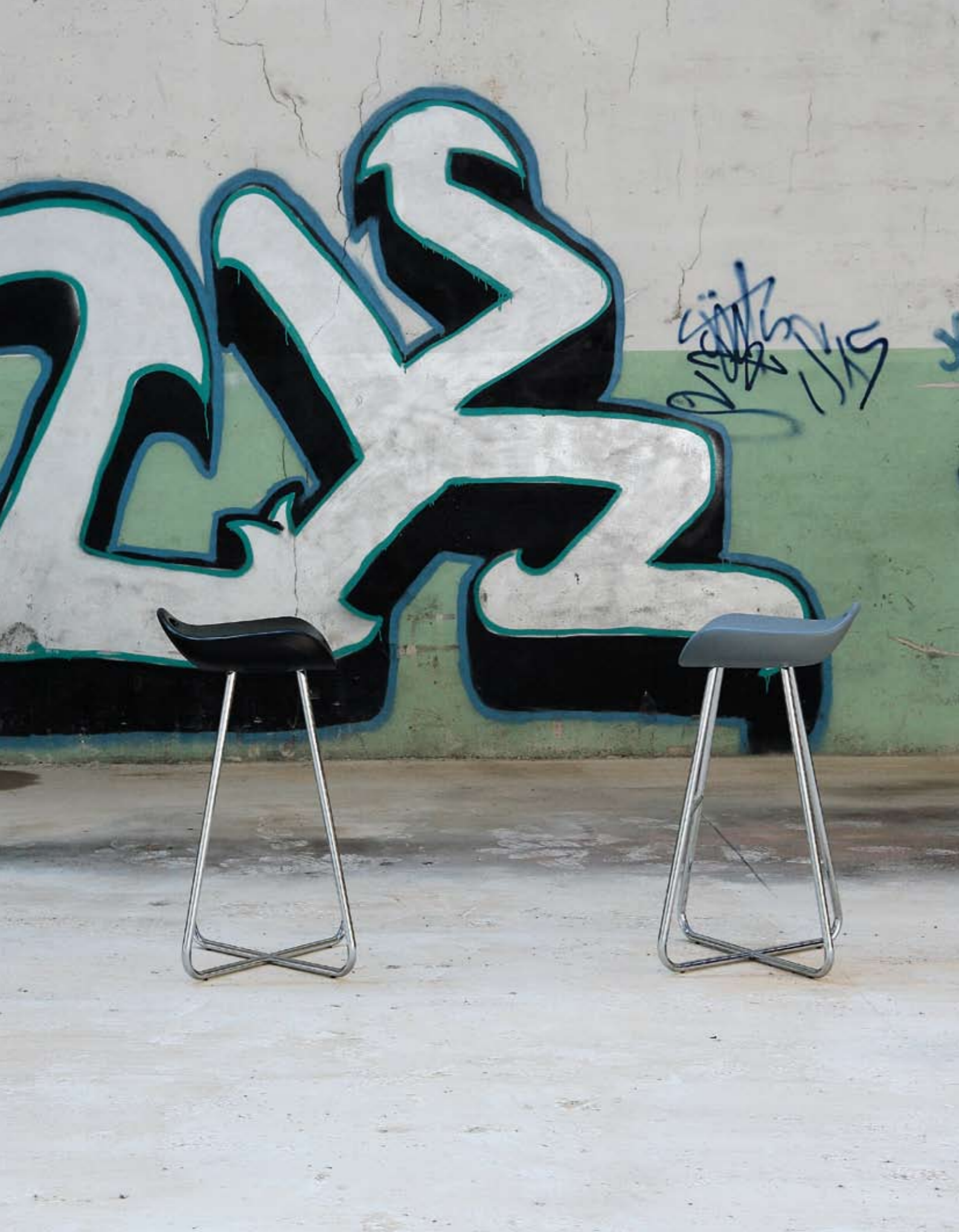
Twenty design Delineodesign sgabello / stool