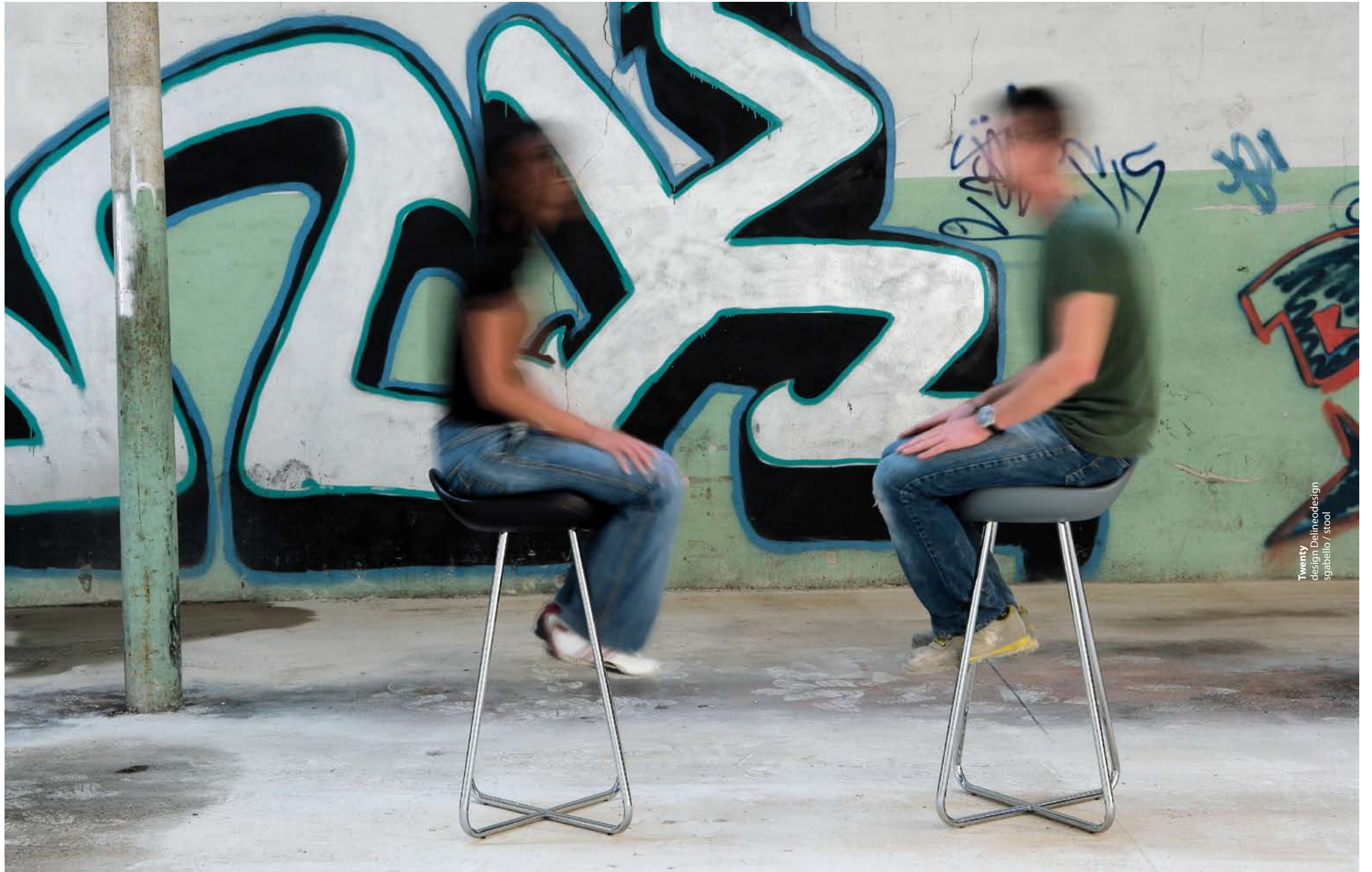
Twenty design Delineodesign sgabello / stool