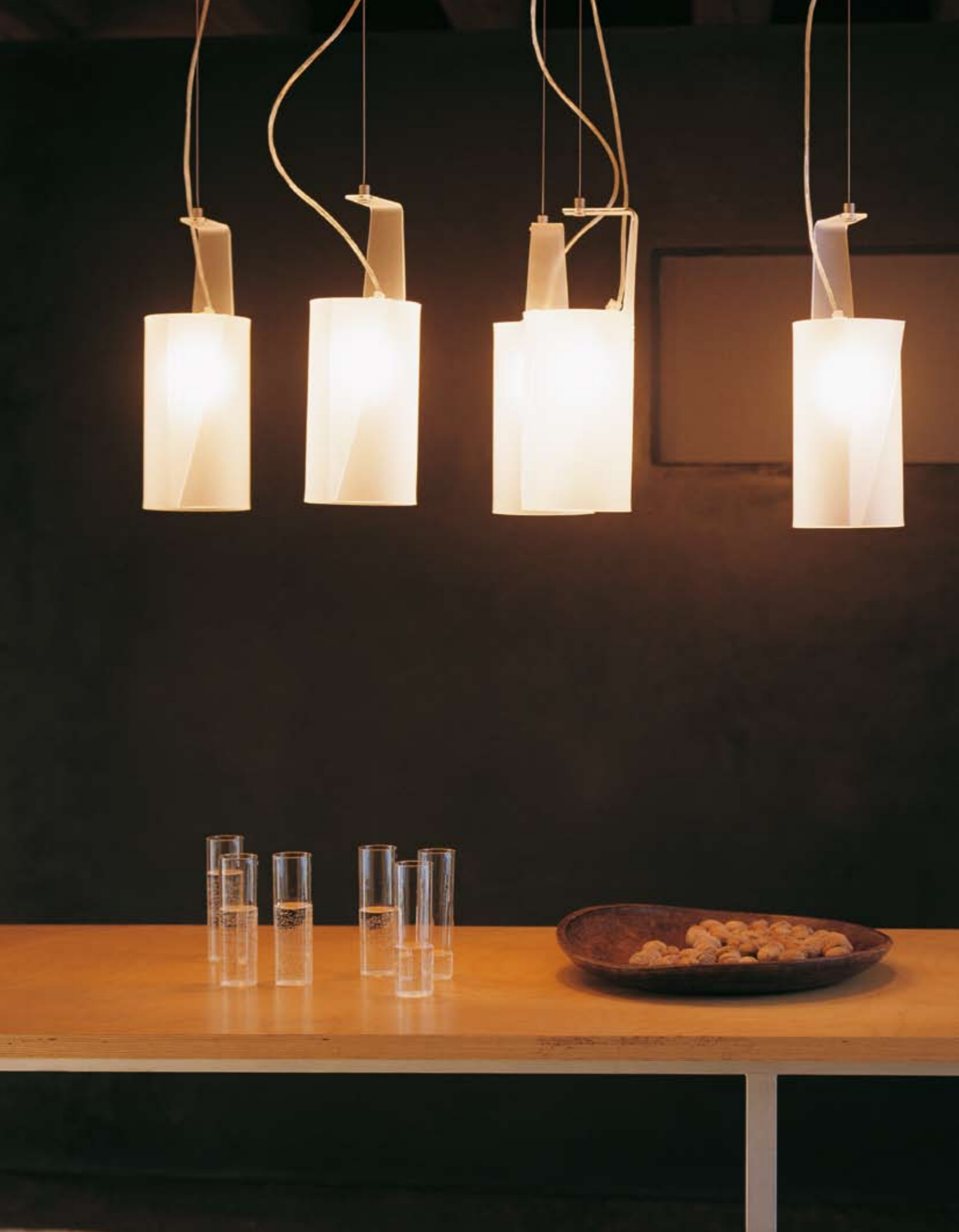
Simpaty design Delineodesign lampada / lamp