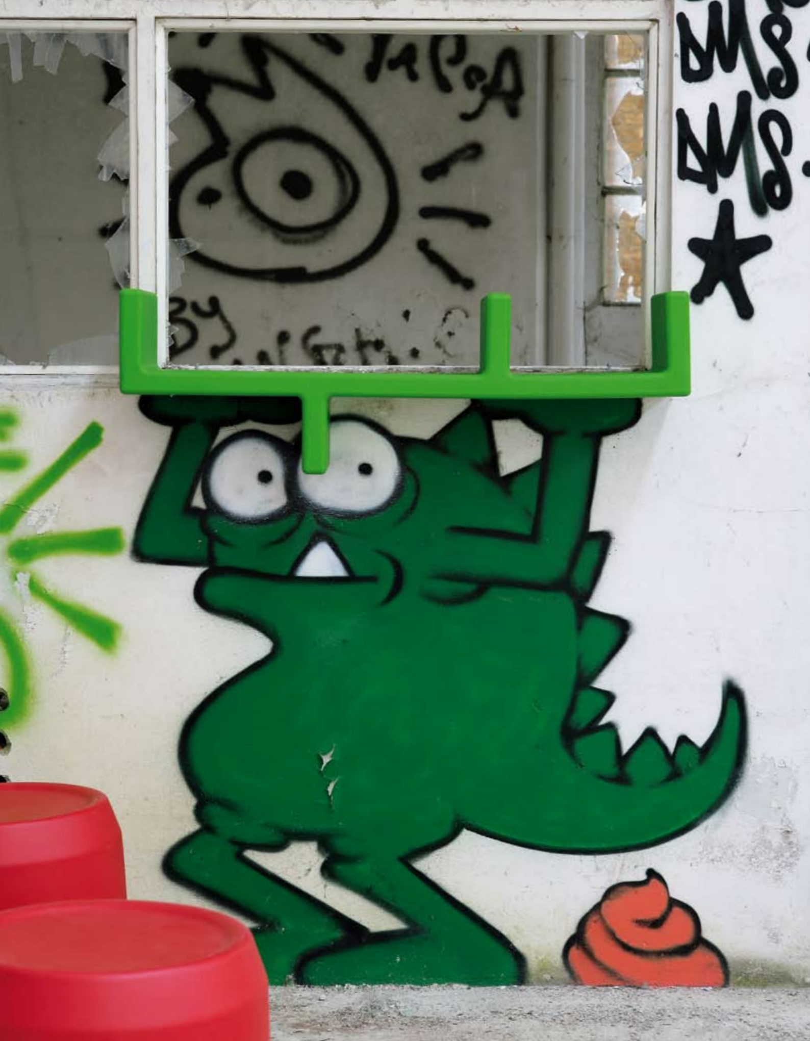
Snake design Baldanzi & Novelli mensola / wall shelf Dodo design Pastorino & Suarez sgabello-contenitore / stool-container