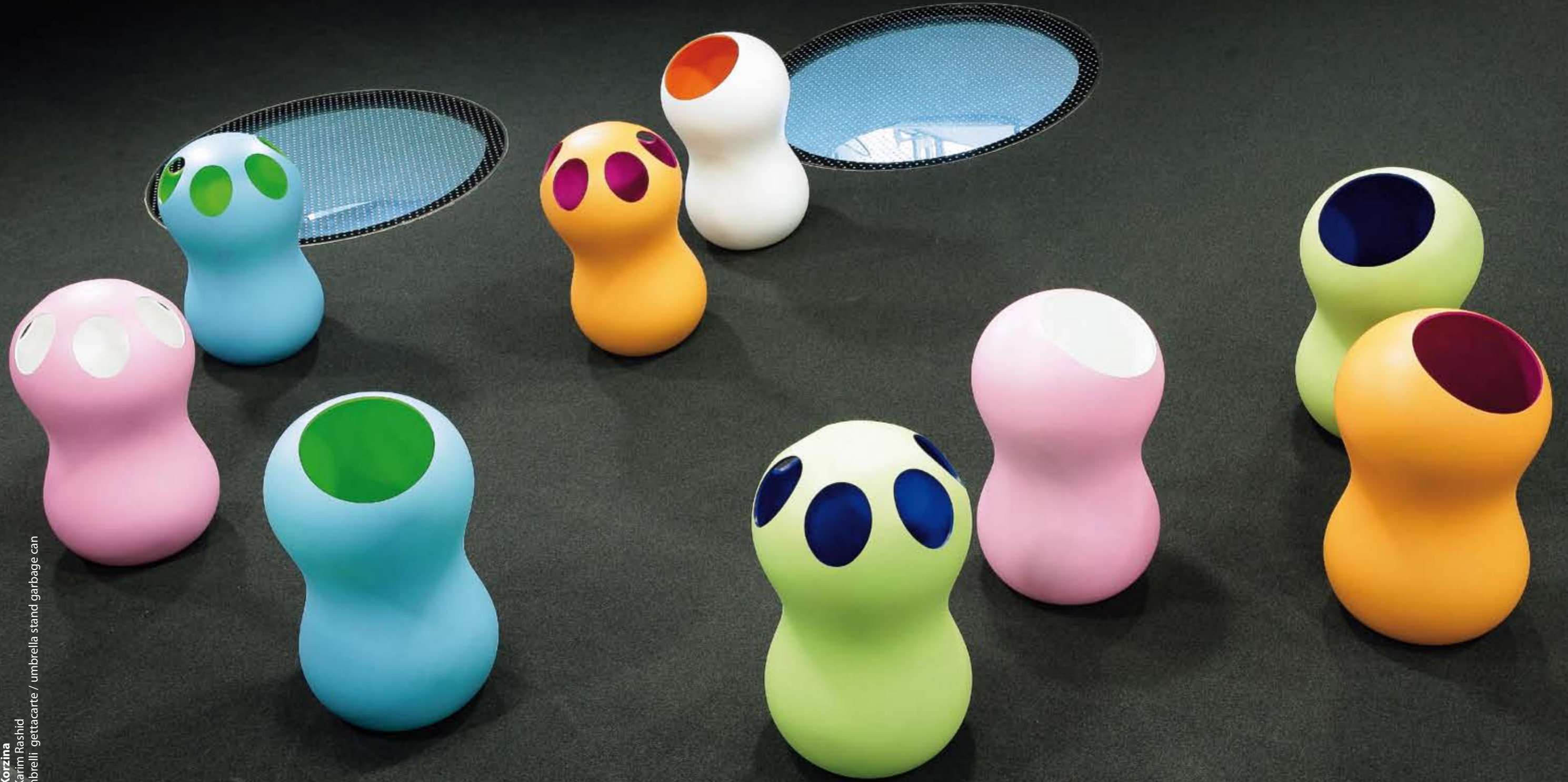
Zontik Korzina design Karim Rashid portaombrelli - gettacarte / umbrella stand - garbage can