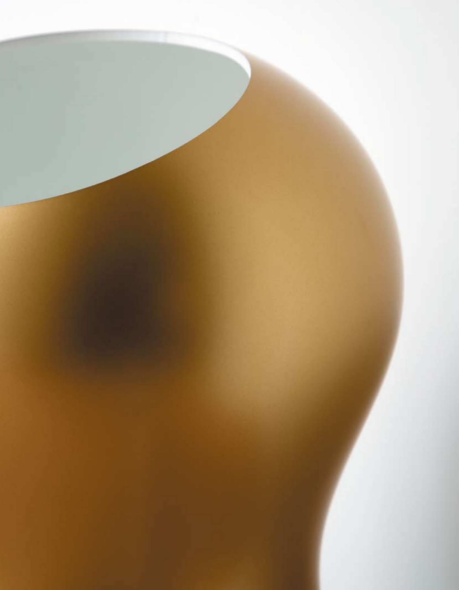
Korzina design Karim Rashid gettacarte / garbage can